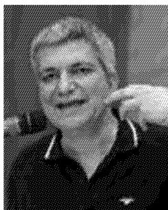
Nichi Vendola Governatore della Puglia, leader di Sinistra e libertà