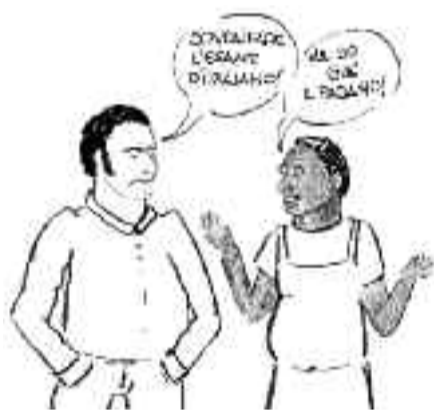
Per gli immigrati, permesso di soggiorno ma solo dopo gli esami

D'altra parte è difficile iscriversi al SSN se non si ha un contratto di lavoro regolare, cosa che capita abbastanza spesso agli immigrati. Ma sono le prime due condizioni quelle davvero speciali. Immaginiamo di fermare per strada un signor Rossi qualunque e di chiedergli a bruciapelo: cosa c'è nella prima parte della Costituzione? Oppure: secondo lei è vero che c'è scritto che uno "straniero, al quale sia impedito nel suo paese l'effettivo esercizio delle libertà democratiche garantite dalla Costituzione italiana, ha diritto d'asilo"? Risultato probabile il rito della cittadinanza italiana al 90% degli interpellati. Ma l'ultima condi-